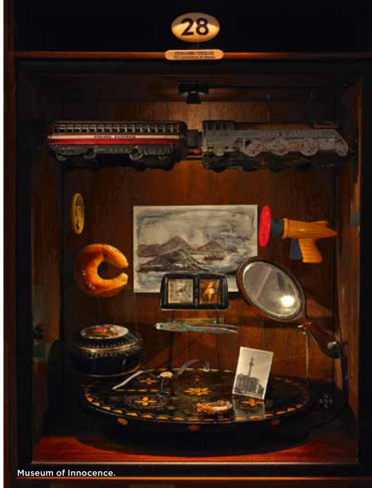
Museum of Innocence.

I entrén finns 4213 cigarettfimpar inmurade i väggen, alla cigaretter som huvudpersonen röker i de 83 kapitlen när hans kvinna lämnat honom och gift sig med en annan man. ■