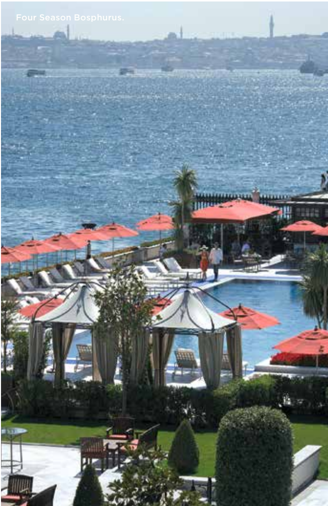
Four Season Bosphorus.