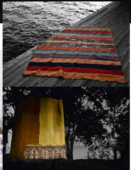
Butikerna Yastik finns i Istanbul, Cesme och London.